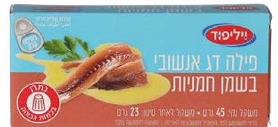
פילה אנשובי בשמן זית Anchovy fillet in olive oil