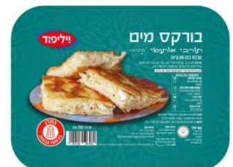
בורקס מים עם גבינה Turkish water pastry cheese