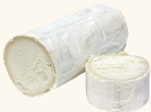
גבינת עיזים רכה Soft goat cheese