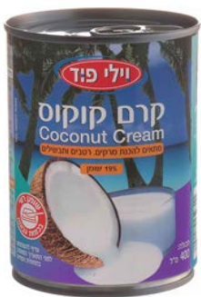
קרום קוקוס Coconut milk 400 מ"ל