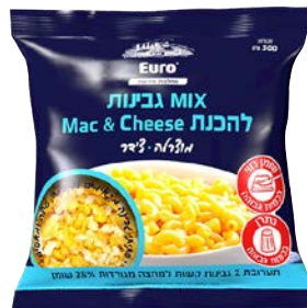
תערובת גבינות למק אנד צ'יז, 28% Cheese Mix for mac&cheese, 28%

300 גרם 55340150 14 יחידות בקרטון 7290117265734