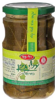
עלי גפן במי מלח Vine leaves in brine