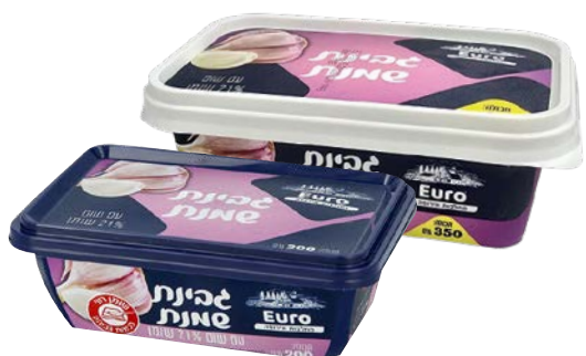
גבינת שמנת, 21%, שום Cream cheese, 21%, Garlic

גרם 200 גרם 350 55300162 55300197 24 יחידות בקרטון 24 יחידות בקרטון 7290108502589 7290117267202