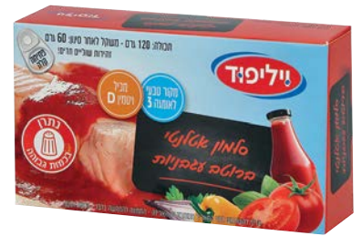
סלמון אטלנטי ברוטב עגבניות Atlantic Salmon in tomato sauce