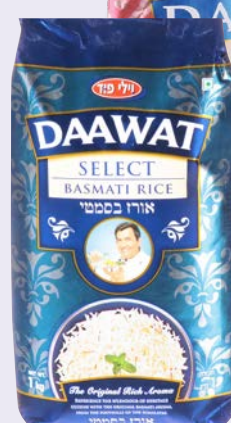
אורז בסמטי Basmati rice