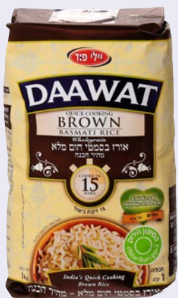
אורז בסמטי חום מלא Basmati brown rice