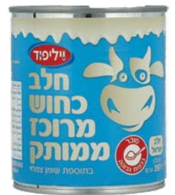
חלב כחוש מרוכז ממותק Condensed milk