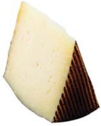
גבינת איבריקו גלגל Iberico cheese wheel