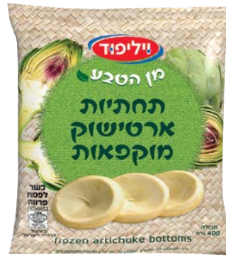
תחתיות ארטישוק מוקפאות Frozen artichoke bottoms