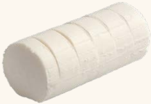
גבינה רכה מחלב בקר, 21% Soft cheese, 21%