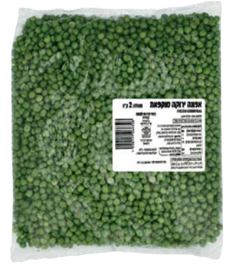
מוסדי אפונה ירוקה מוקפאת Frozen peas