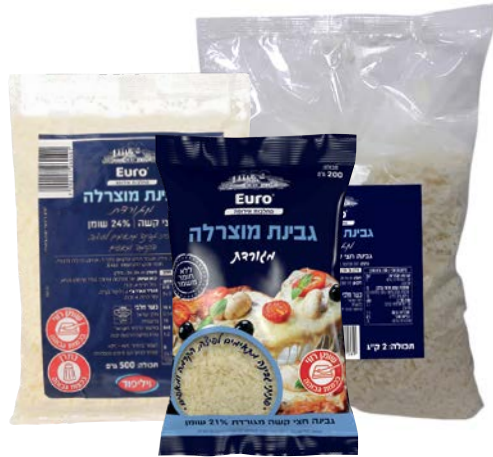
גבינת מוצרלה, 27%, מגורדת Mozzarella cheese, 27%, grated

2 ק"ג מוסדי 500 גרם 200 גרם 55340005 55301703 55340120 55340056 55340108 12 יחידות בקרטון 12 יחידות בקרטון 12 יחידות בקרטון 7290108507089 7290117260401 7290014692817