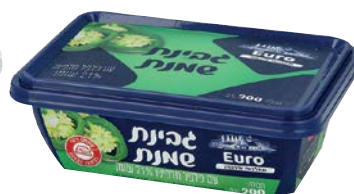
גבינת שמנת, 21%, חלפניו Cream cheese, 21%, Jalapeno

גרם 200 55300161 24 יחידות בקרטון 7290108504385