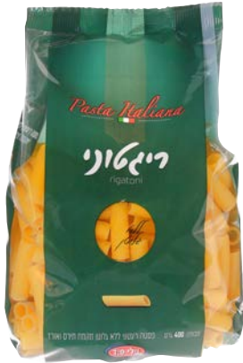
פסטה ריגטוני | Pasta rigatoni