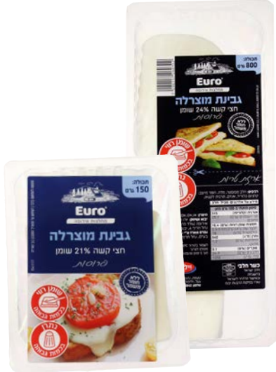
גבינת מוצרלה, 24%, פרוסות Mozzarella cheese, 24%, slices