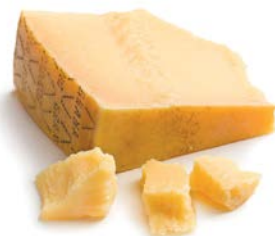
גרנה פדנו שמיניות Grana padano eighths