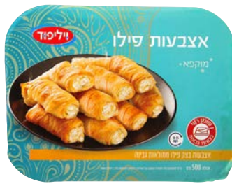
אצבעות פילו ממולאות גבינה Filled rolls cheese