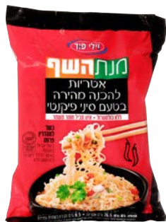
איטריות להכנה מהירה בטעם סיני פיקנטי Instant noodles spicy chinese flavour