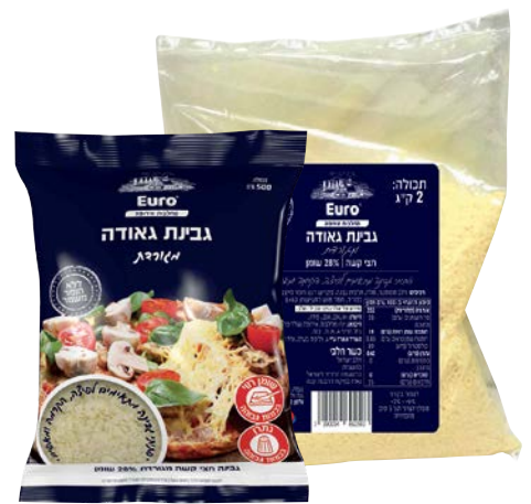
גבינת גאודה, 27%, מגורדת Gouda cheese, 27%, grated

2 ק"ג מוסדי 500 גרם 55340004 55010006 55340093 12 יחידות בקרטון 12 יחידות בקרטון 7290014692503 7290108501346