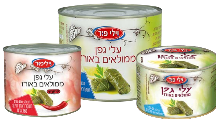
עלי גפן ממולאים באורז Vine leaves stuffed with rice