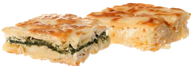
בורקס מים עם גבינה ותרד מוסדי Turkish water pastry cheese & spinach