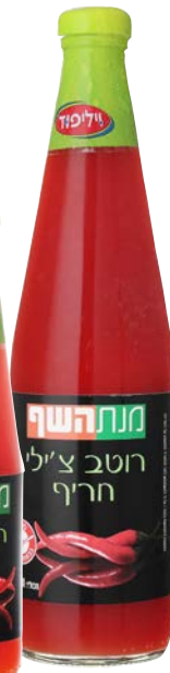
רוטב ציילי חריף Hot chilli sause