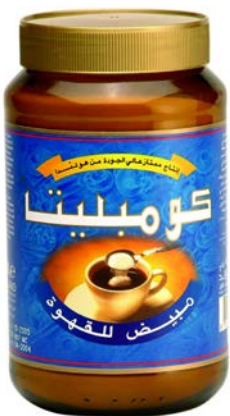
קומפלטת מלבין קפה הולנדי (ש.ע) חדש Coffee whitener Holland