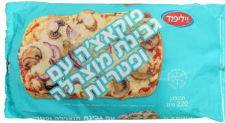
פוקאצ'יה עם גבינת מוצרלה ופטריות Focaccia mozzarella cheese & mushroom