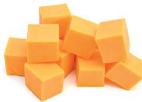
צ'דר בשלה בלוק Cheddar Matured block