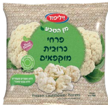
פרחי כרובית מוקפאים Frozen cauliflower florets