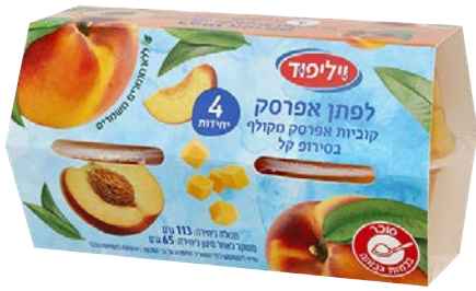
לפתן אפרסק בסירוף קל | רביעייה Diced peaches in light syrup | 4-pack גרם 113/65