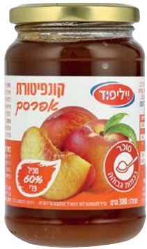
קונפיטורת אפרסק Peach jam