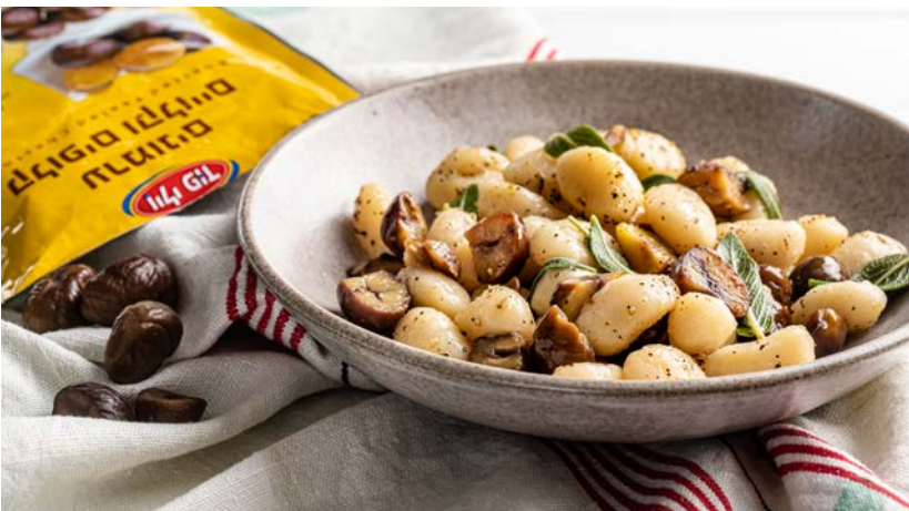
ערמונים קלופים וקלויים Roasted peeled chesnuts