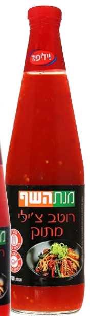
רוטב ציילי מתוק Sweet chilli sause