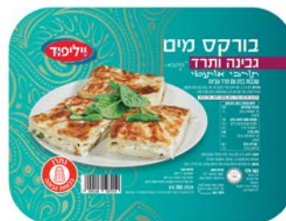
בורקס מים עם גבינה ותרד Turkish water pastry cheese & spinach