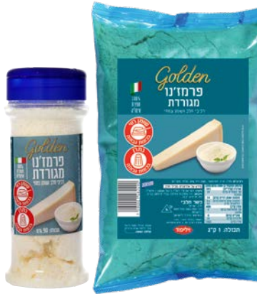
Golden פרמזנו מגורד למעדניה Parmigiano grated

90 גרם 1 ק"ג 55300092 55300065 12 יחידות בקרטון 12 יחידות בקרטון 7290008175210 7290001482490