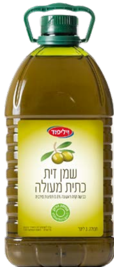
שמן זית כתית מעולה Olive oil