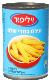
תירס גמדי Baby corn