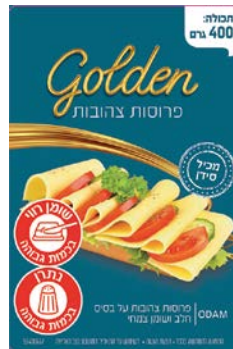
צ'הובה פרוסות Golden Golden slices