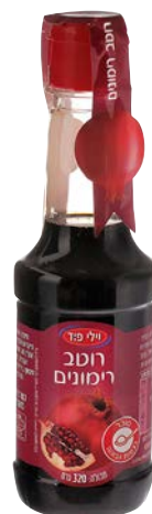
רטוב רימונים Pomegranate concentrate 320 מ"ל