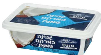
גבינת שמנת לייט, 5%, טבעי Cream cheese light, 5%, Natural

גרם 200 55300166 24 יחידות בקרטון 7290108502558