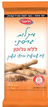
מקלוני גריסיני ללא גלוטן עם שומשום וזרעי פשתן Gluten-free Grissini sticks with sesame and flax seeds

120 גרם 69100238 12 יחידות בקרטון 7290117260739