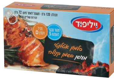
סלמון אטלנטי מעושן בשמן קנולה Atlantic smoked Salmon in canola oil