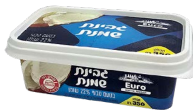
גבינת שמנת, 22%, טבעי Cream cheese, 22%, Natural

גרם 350 55300195 24 יחידות בקרטון 7290117267189