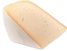
גבינת עיזים גלגל Goat cheese wheel