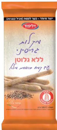
מקלוני גריסיני ללא גלוטן עם קמח כוסמת מלא Gluten-free grissini sticks with whole buckwheat flour

120 גרם 69100239 12 יחידות בקרטון 7290117260746