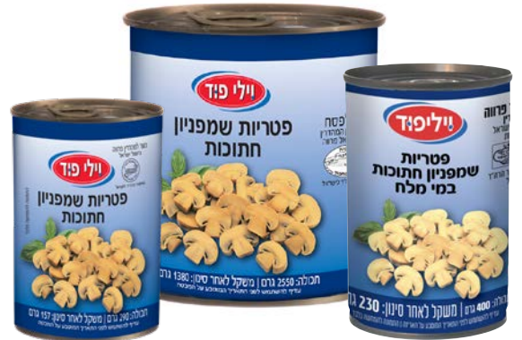
פטריות שמפיניון חתוכות במי מלח Champignons mushrooms pieces in brine