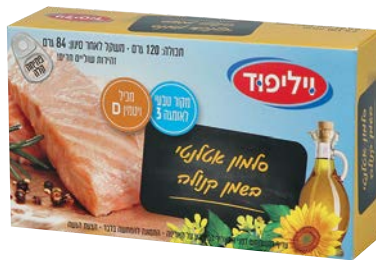
סלמון אטלנטי בשמן קנולה Atlantic Salmon in canola oil