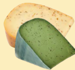
גבינות גאודה גלגל עם מגוון תוספות Gouda cheese wheel with various additions