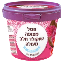
פטל מצופה שוקולד חלב מעולה Raspberries coated in premium milk chocolate