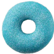
מאפה דונאטס בציפוי ובמילוי בטעם מסטיק פירות יער Donut with berry bubble gum flavored filling and glaze