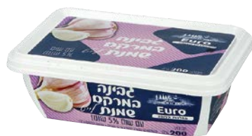
גבינת שמנת לייט, 5%, שום Cream cheese light, 5%, Garlic

גרם 200 55300168 24 יחידות בקרטון 7290108502596