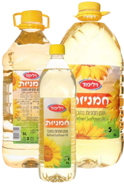
Sunflower oil שמן חמניות