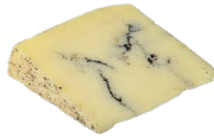
גבינה מחלב כבשים עם פטריות כמהין גלגל Sheep milk cheese with truffle mushrooms wheel