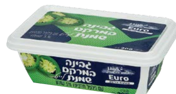
גבינת שמנת לייט, 5%, חלפניו Cream cheese light, 5%, Jalapeno

גרם 200 55300165 24 יחידות בקרטון 7290108504408