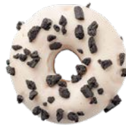
מאפה דונאטס במילוי קרם ובעיטור שבירי עוגיות Donut filled with cream and decorated with cookie crumbs