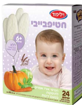
חטיף אורז אפוי לתינוקות בטעם ירקות Baby rice snacks, vegetable flavored