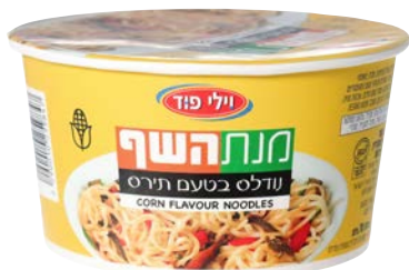
נודלס בטעם תירס Corn flavour noodles