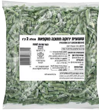
מוסדי שעועית ירוקה חתוכה מוקפאת Frozen cut green bean