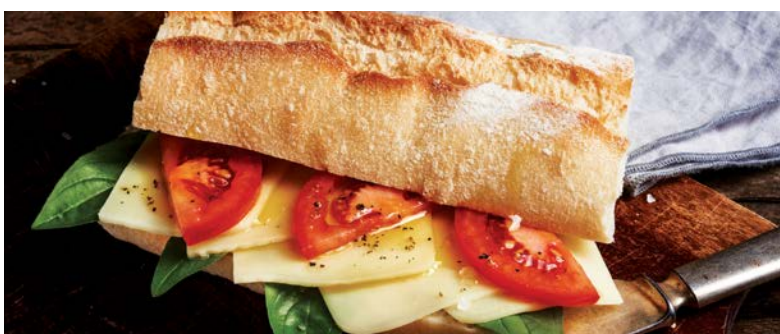
גבינת עיזים, 30%, פרוסות Goat cheese, 30%, slices