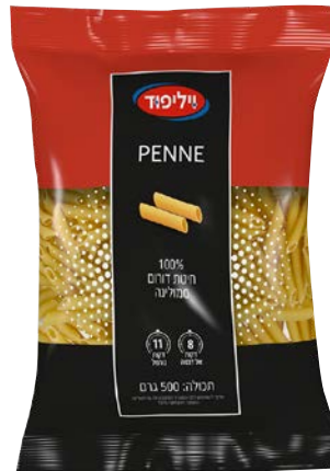
פסטה Penne 500 גרם 57101713 20 יחידות בקרטון 7290003781881