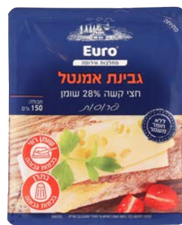
גבינת אמנטל, 28%, פרוסות Emental cheese, 28%, slices