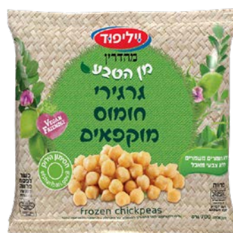
גרגירי חומס מוקפאים Frozen chickpeas