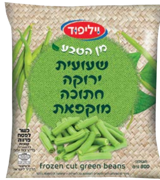
שעועית ירוקה חתוכה מוקפאת Frozen cut green beans