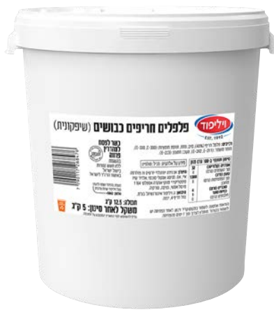
פלפלים חריפים כבושים (שיפקונית) Pickled hot peppers (Shifka)