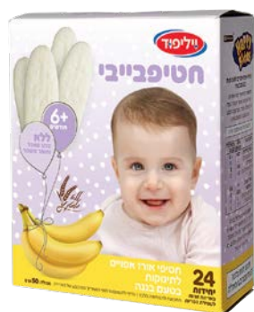
חטיף אורז אפוי לתינוקות בטעם בננה Baby rice snacks, banana flavored