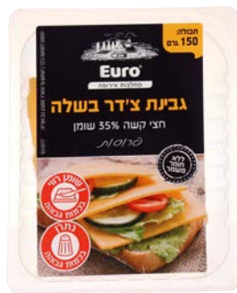
גבינת צ'דר בשלה, 35%, פרוסות Matured cheddar, 35%, slices