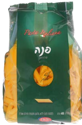
פסטה פנה | Pasta penne