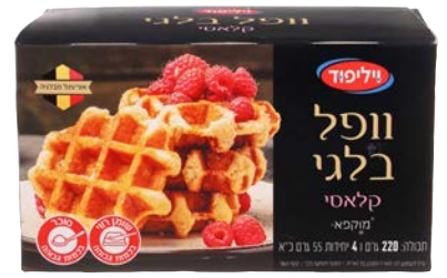
וופל בלגי קלאסי Belgian waffles classic