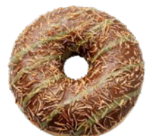
מאפה דונאטס במילוי וציפוי בסגנון שוקולד דובאי Donut pastry with Dubai-style chocolate filling and coating