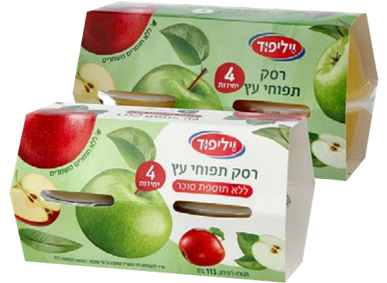
רסק תפוחי עץ | רביעייה 4-pack Applesauce | 4-pack גרם 113

ללא תוספת סוכר 25230003 12 יחידות בקרטון 7290117266021