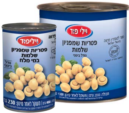
פטריות שמפיניון שלמות במי מלח Whole champignons mushrooms in brine