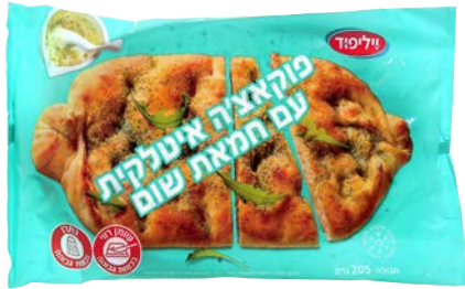
פוקאצ'יה איטלקית עם חמאת שום Romana appetizer with garlic butter