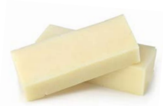
Mozzarella block מוצרלה בלוק