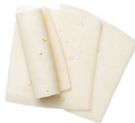
גבינת עיזים בלוק Goat cheese block