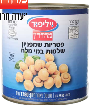
פטריות שמפיניון שלמות במי מלח Whole champignons mushrooms in brine