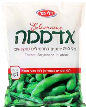
אדממה פולי סויה מוקפאים Edamame soybeans in pods