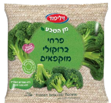
פרחי ברוקולי מוקפאים Frozen broccoli florets