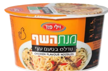
נודלס בטעם עוף Chicken flavour noodles