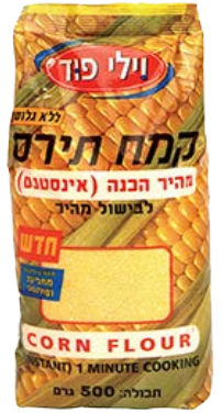
קמח תירס מהיר הכנה (אינסטנט) Corn flour (instant) 500 גרם