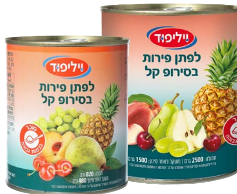
Fruit mix in light syrup לפתן פירות בסירופ קל