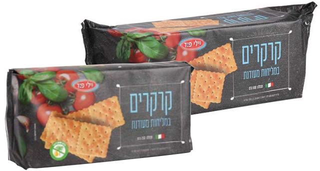
Crackers with salt קרקרים במליחות מעודנת

250 גרם 68100316 20 יחידות בקרטון 7290108502268