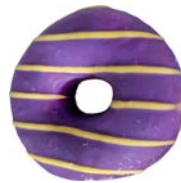
מאפה דונאטס במילוי קרם בטעם פירות Donut ring of joy with fruit filling