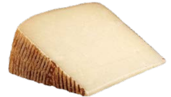
גבינת פקורינו מחלב כבשים גלגל Pecorino sheep milk cheese wheel