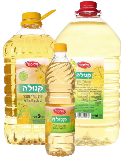
Canola oil שמן קנולה