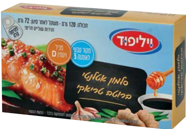
סלמון אטלנטי ברוטב טריאקי Atlantic Salmon in teriyaki sauce