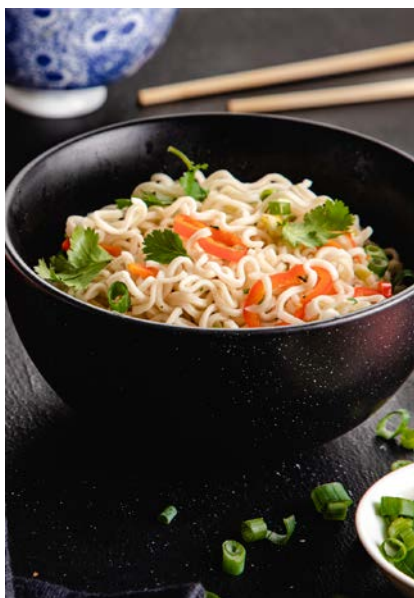
נודלס בטעם פטריות Mushrooms flavour noodles