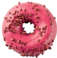
מאפה דונאטס במילוי קרם בטעם דובדבנים Donut viva magenta with cherry filling