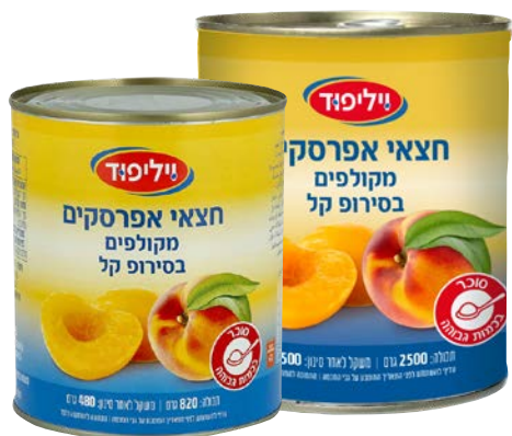
Peach halves in light syrup חצאי אפרסקים בסירופ קל