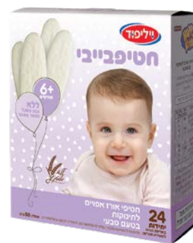
חטיף אורז אפוי לתינוקות בטעם טבעי Baby rice snacks, naturally flavored