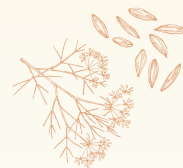
גאודה עם כמון Gouda cheese with cumin