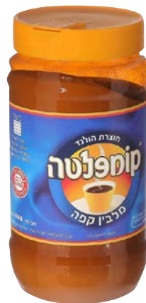
קומפלטת מלבין קפה הולנדי Coffee whitener Holland