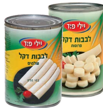
לבבות דקל Hearts of palm