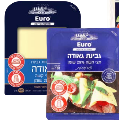
גבינת גאודה, 28%, פרוסות Gouda cheese, 28%, slices