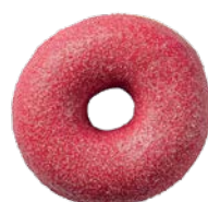
מאפה דונאטס בציפוי ובמילוי בטעם תות שדה Donut with strawberry-flavored filling and glaze