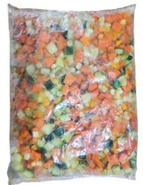
מוסדי תערובת ירקות מוקפאת Frozen vegetables mix