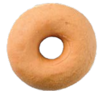
מאפה דונאטס Donut