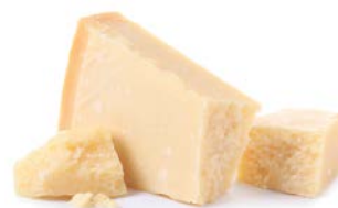
פרמזינו רגיאנו רבעים Parmigiano reggano quarters