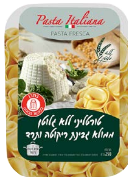
טורטיליני ממולא גבינת ריקוטה ותרד | Spinach & ricotta tortelli