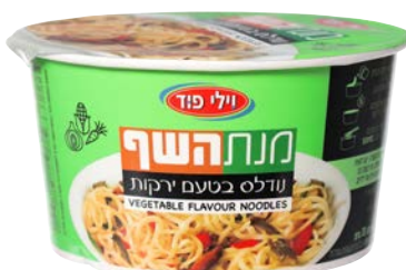
נודלס בטעם ירקות Vegetable flavour noodles