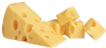
אמנטל בלוק Emental block