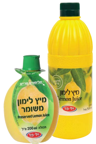
מיץ לימון משומר Preserved lemon juice 200 מ"ל