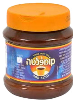
קומפלטת מלבין קפה הולנדי Coffee whitener Holland