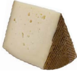
גבינת מנציגו מחלב כבשים גלגל Manchego sheep milk cheese wheel