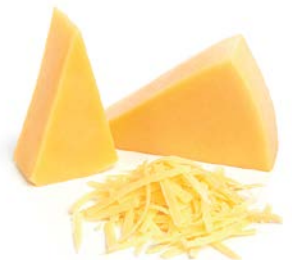
קשקבל בלוק Kashkaval block