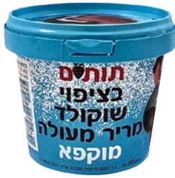
תותים בציפוי שוקולד מרי Dark chocolate covered strawberries