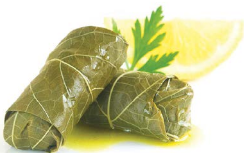
עלי גפן ממולאים באורז Vine leaves stuffed with rice