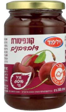
קונפיטורת דובדבנים Cherry jam