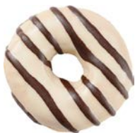
מאפה דונאטס בציפוי טעם וניל ופסי עיטור בטעם שוקולד Donut with vanilla-flavored coating and chocolate-flavored drizzle