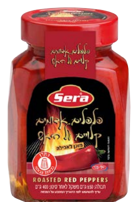
פלפל אדום קלוי על האש Roasted red peppers