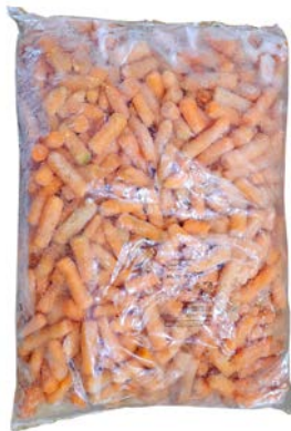
מוסדי גזר גמדי מוקפא Frozen baby carrots