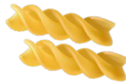
פסטה Big Fusilli מוסדי 5 ק"ג 57101726 2 יחידות בקרטון 7290003781249