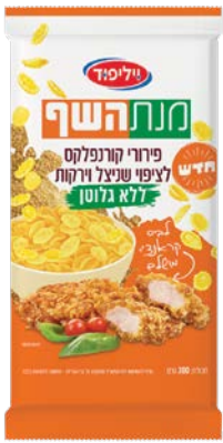
פירורי קורנפלקס לציפוי שניצל וירקות ללא גלוטן Gluten-free cornflakes crumbs for schnitzel and vegetable 300 גרם