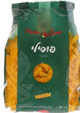
פסטה פוסילי | Pasta fusilli