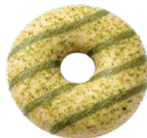
מאפה דונאטס במילוי וציפוי מאצ'ה Donut pastry with matcha filling and coating