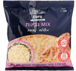
מיקס גבינות, 26%, מגורדות Cheese Mix, 26%, grated

300 גרם 55340101 14 יחידות בקרטון 7290117261910