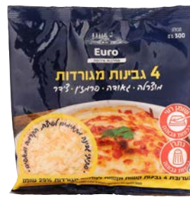
4 גבינות, 29%, מגורדות Four cheeses, 29%, grated

300 גרם 55340107 14 יחידות בקרטון 7290108509274