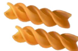
פסטה Big Fusilli מוסדי 50% חממת דרום המלכה 50% קמח חיטה מלאה 5 ק"ג 57110120 2 יחידות בקרטון 7290117266915