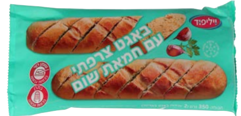
באגט צרפתי עם חמאת שום French baguettes with garlic butter