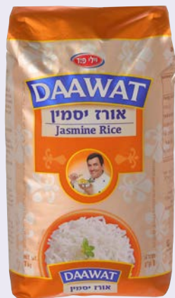
אורז יסמין Jasmine rice