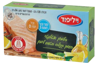
סלמון אטלנטי בשמן קנולה בטעם לימון Atlantic Salmon in canola oil with lemon flavor