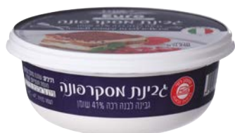
גבינת מסקרפונה Mascarpone

גרם 250 55330406 6 יחידות בקרטון 7290108503531