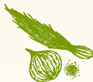
גאודה עם עשבי תיבול Gouda with herbs