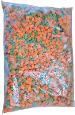
מוסדי לקט אפונה וגזר מוקפא Frozen peas