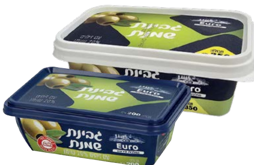
גבינת שמנת, 20%, זיתים Cream cheese, 20%, Olives

גרם 200 גרם 350 55300160 55300196 24 יחידות בקרטון 24 יחידות בקרטון 7290108504378 7290117267196