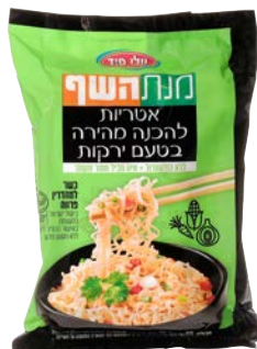
איטריות להכנה מהירה בטעם ירקות Instant noodles vegetable flavour