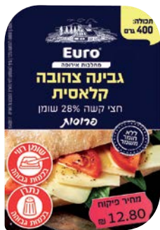
גבינה צהובה קלאסית, 28%, פרוסות Classic cheese, 28%, slices