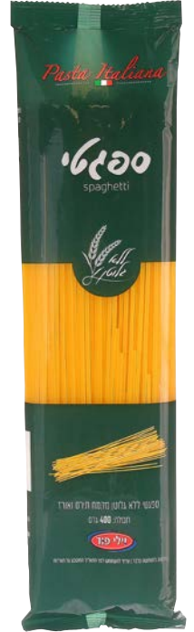
ספגטי | Spaghetti