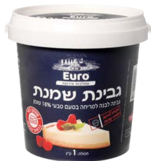
גבינת שמנת, 18%, טעם טבעי Cream cheese, 18%, Natural

1 ק"ג 55300158 6 יחידות בקרטון 7290001022375