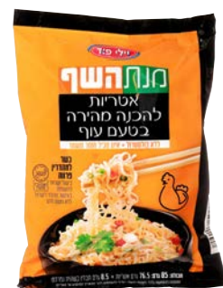
איטריות להכנה מהירה בטעם עוף Instant noodles chicken flavour