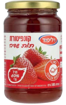
קונפיטורת תות שדה Strawberry jam