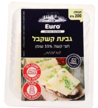
גבינת קשקבל, 33%, פרוסות Kashkaval cheese, 33%, slices