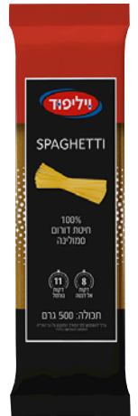
פסטה Spaghetti 500 גרם 57101711 20 יחידות בקרטון 7290003781904