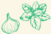
גאודה עם תערובת בדיליקום ושום Gouda with basil & garlic