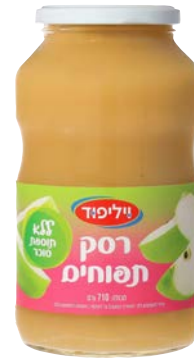
רסק תפוחים ללא תוספת סוכר Applesauce sugar free גרם 710