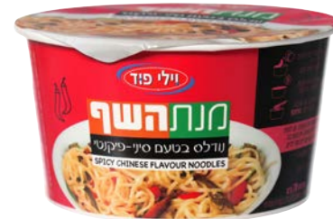
נודלס בטעם סיני פיקנטי Spicy chinese flavour noodles