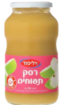
רסק תפוחים Applesauce גרם 720