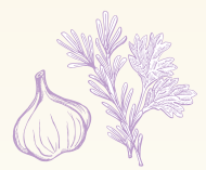
גאודה עם עשבי תיבול ושום Gouda with herbs and garlic