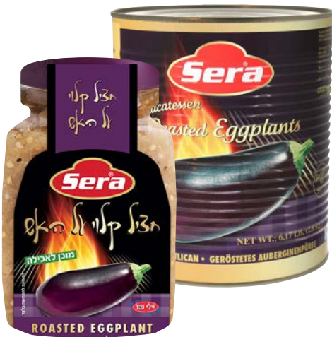
חציל קלוי על האש Roasted eggplant