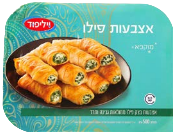
אצבעות פילו ממולאות גבינה ותרד Filled rolls cheese & spinach