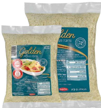
Golden צהובה, מגורדת Golden, grated

2 ק"ג מוסדי 500 גרם 55340011 55340052 6 יחידות בקרטון 12 יחידות בקרטון 7290014692510 7290014692541