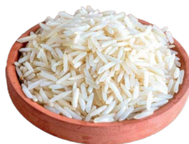
אורז יסמין מוסדי Jasmine rice