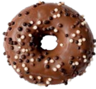
מאפה דונאטס בציפוי טעם קרמל Donut with caramel flavored coating