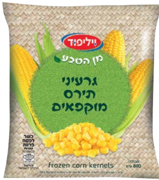
גרעיני תירס מוקפאים Frozen corn kernels