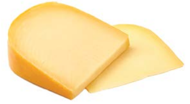
גאודה הולנדית גלגל Dutch gouda wheel