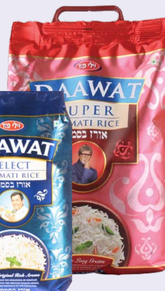
אורז בסמטי Basmati rice