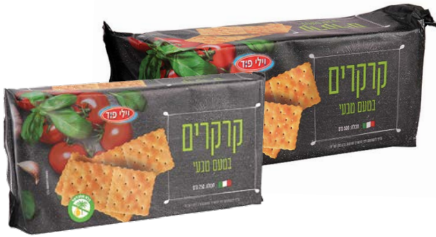
Crackers natural קרקרים בטעם טבעי

250 גרם 68100317 20 יחידות בקרטון 7290108502251