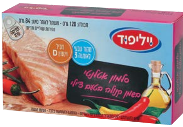
סלמון אטלנטי בשמן קנולה בטעם ציילי Atlantic Salmon in canola oil with chilly flavor