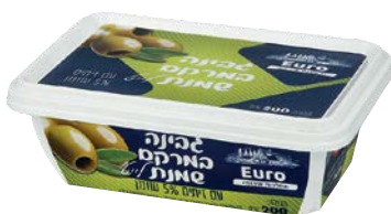
גבינת שמנת לייט, 5%, זיתים Cream cheese light, 5%, Olives

גרם 200 55300164 24 יחידות בקרטון 7290108504392