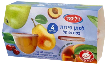
לפתן פירות בסירוף קל | רביעייה Fruit mix in light syrup | 4-pack גרם 113/65