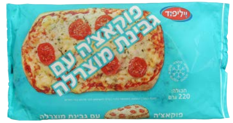
פוקאצ'יה עם גבינת מוצרלה Focaccia mozzarella cheese