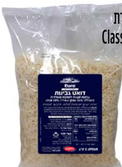
גבינה צהובה קלאסית, 28%, מגורדת Classic yellow cheese, 28%, grated

400 גרם 55340163 12 יחידות בקרטון 7290117268445