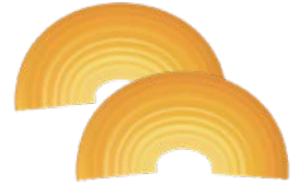
פסטה Elbows מוסדי 5 ק"ג 57101726 2 יחידות בקרטון 7290010839322