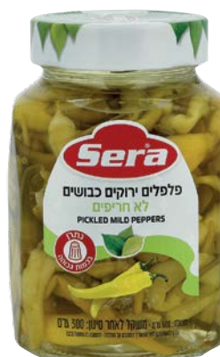
פלפלים ירוקים כבושים לא חריפים Pickled mild peppers