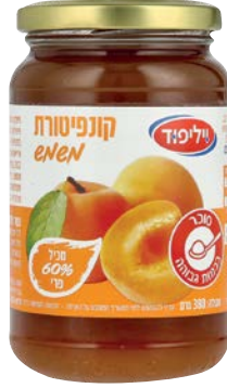
קונפיטורת משמש Apricot jam