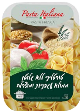
טורטיליני ממולא עגבניות ומוצרלה | Tomato & mozzarella tortelli