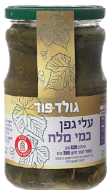
עלי גפן במי מלח Vine leaves in brine