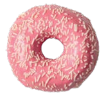
מאפה דונאטס בציפוי ורוד ובעיטור שוקולד לבן Donut pink frosting and white chocolate decoration