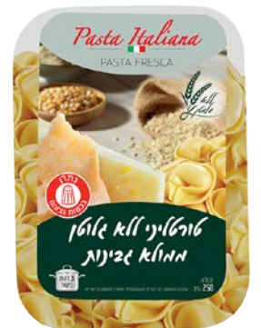
טורטיליני ממולא גבינות | Cheese tortelli