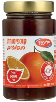
קונפיטורת תפוזים Orange jam