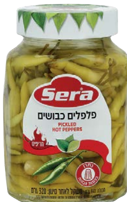
פלפלי כבושים חריפים Pickled hot peppers