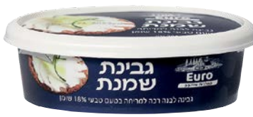
גבינת שמנת, 18%, טבעי Cream cheese, 18%, Natural

גרם 200 55300163 24 יחידות בקרטון 7290108502541