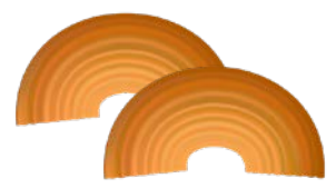
פסטה Elbows מוסדי 50% חממת דרום המלכה 50% קמח חיטה מלאה 5 ק"ג 57110121 2 יחידות בקרטון 7290117266922