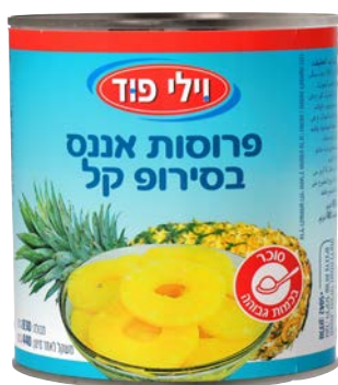
Pineapple slices in light syrup פרוסות אננס בסירופ קל