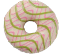
מאפה דונאטס בציפוי ובמילוי גויאבה Donut with guava filling and glaze