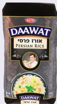
אורז פרסי Persian rice