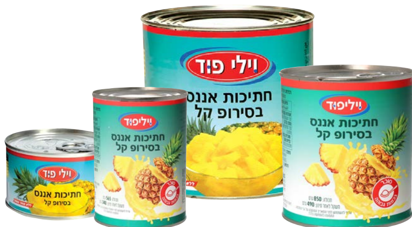
Pineapple pieces in light syrup חתיכות אננס בסירופ קל