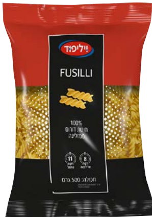
פסטה Fusilli 500 גרם 57101704 20 יחידות בקרטון 7290003781959