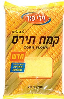
קמח תירס Corn flour 1 ק"ג