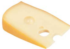
מאסדם רבעים Maasdam quarters