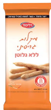
מקלוני גריסיני ללא גלוטן Gluten-free Grissini sticks

120 גרם 69100237 12 יחידות בקרטון 7290117260722