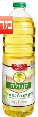
שמן קנולה Canola oil