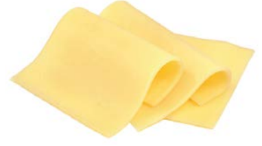
Gauda block גאודה בלוק