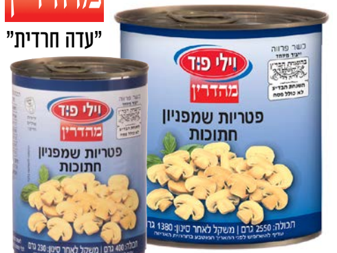
פטריות שמפיניון חתוכות במי מלח Champignons mushrooms pieces in brine