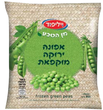
אפונה ירוקה מוקפאת Frozen green peas