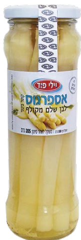
אספרגוס לבן שלם מקולף White asparagus spears in brine