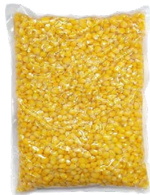
מוסדי גרעיני תירס מוקפאים Frozen corn kernels