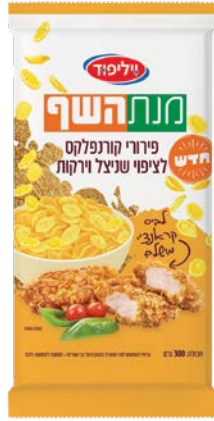
פירורי קורנפלקס לציפוי שניצל וירקות Cornflakes crumbs for schnitzel and vegetable 300 גרם