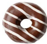
מאפה דונאטס בציפוי טעם שוקולד ופסי עיטור בטעם וניל Donut with chocolate-flavored coating and vanilla-flavored drizzle